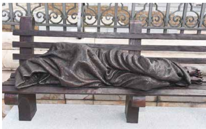
Jesús sin techo. Autor: Timothy P. Schmalz

Contemplamos la imagen de la escultura y hablamos de lo que creemos que los autores quisieron constatar y por qué.