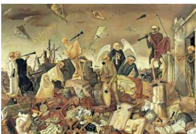
El triunfo de la muerte