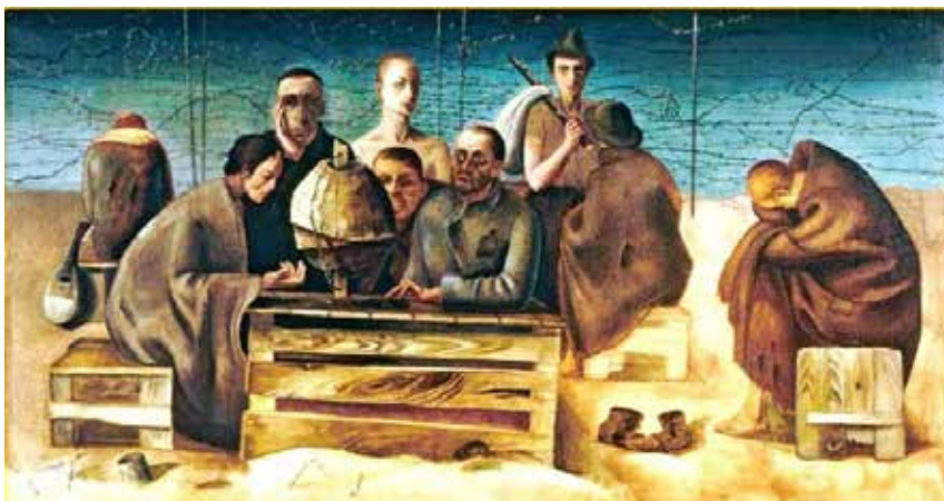
Prisioneros en Saint Cyprien. Varias personas rodean una caja de madera encima de la cual hay un globo terráqueo cruzado por una alambrada de espinos